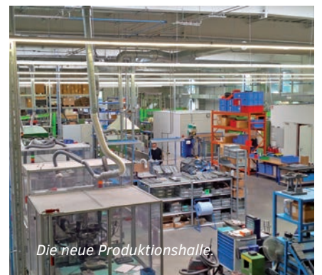
Die neue Produktionshalle.