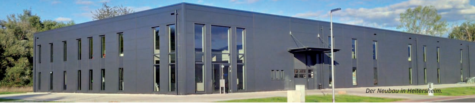
Der Neubau in Heitersheim.