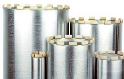
Neue Heger Diamant-Bohrkronen.

Ein weiterer Fokus lag im letzten Jahr auf der Entwicklung der neuen Bohrsegmentspezifikationen. Die Kundenresonanz nach der Produkteinführung Anfang 2016 bestätigt die während der Entwicklung gewonnenen Erkenntnisse und erzielten Ergebnisse. Die zur Verfügung stehenden Segmenttypen bieten dem Anwender die Möglichkeit, ein Optimum an Effizienz in der jeweiligen Anwendung zu erzielen.